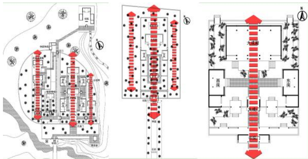
图 1 尼山书院轴线 图 2 洙泗书院轴线 图 3 春秋书院线