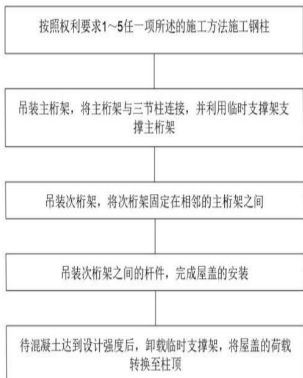
图 2 为钢柱的结构示意图； 图 12 为站房的施工流程图；