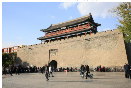
图 3-2 拱极楼