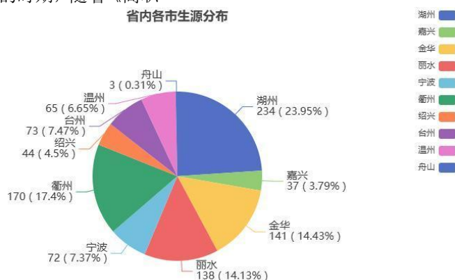
图 1：省内各市生源分布