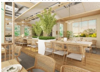
图 3-2 茶室效果图(笔者制绘)