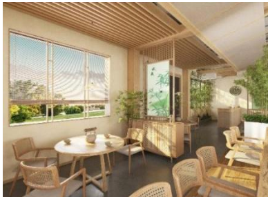
图 3-1 茶室效果图(笔者制绘)

蕴浓缩于此。在这样的色彩搭配下,空间的色彩也不再仅是视觉上的呈现,更成为了情感与文化的载体。每一抹绿色、每一片原木色,都好像在诉说着独属于武夷山故事,让游客暂时忘却了外界的喧嚣与纷扰,全身心的沉浸在这片由色彩编织的静谧世界之中。