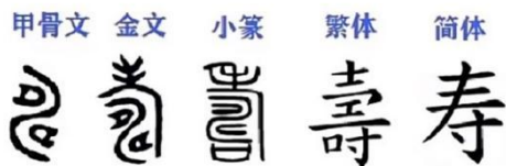
图 2 寿体演变