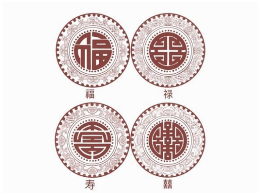
图 3 “福祿壽禧”图案纹样