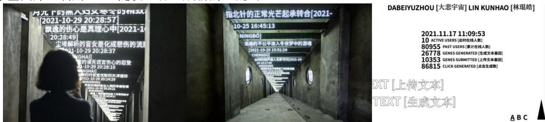
作品三：《文本基因计划》（图4-3）