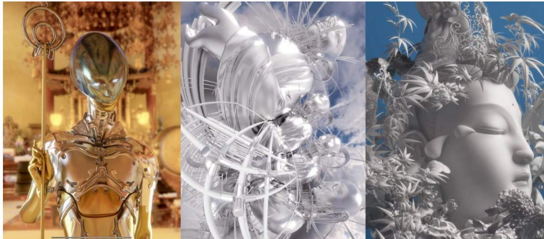
作品一：《未来仏》系列（图4-1）

2019年林琨皓的第一只3D虚拟蝴蝶诞生，后来在个人采集和AI算法的作用下，数百万只经由艺术家挑选和调整的蝴蝶诞生。该作品创作之初曾通过各流媒体平台发布过一个名为“捕蝶计划”的项目，用户可以通过输入姓名领养一只独一无二的虚拟蝴蝶，这一系列作